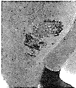
Figur 2. Brännskadat knä efter rugbymatch på tredje generationens konstgräs.

Ett annat orosmoment som belysts är ökad risk för allvarliga bakterieinfektioner, såsom methicillin-resistent Staphylococcus Aureus , vid sårskador som förorsakats i samband med fall på konstgräs. En tidig studie har visat på förhöjd förekomst av denna bakterie hos spelare i ett fotbollslag, där man misstänkte brännskador till följd av fall på konstgräs, i kombination med att spelarna hade rakat benen [Bégier et al 2004]. Brännskador är ett känt problem hos fotbolls- samt rugbyspelare [SL2013] och den allmänna uppfattningen hos idrottsutövare är att de är vanligare vid spel på konstgräs (Fig 2).